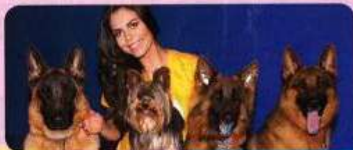
Daniela Albuquerque e seus quatro cães: Chico, Libo e Miia (da raça Pastor Alemão) e Smart (da raça Yorkshire).