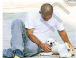
Projeto foi implantado em julho de 2011