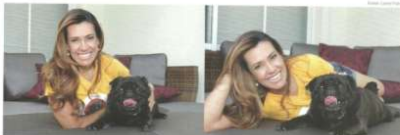
Fração e o cão Grande Otelo, símbolo da campanha "Diga Não à Leishmaniose"