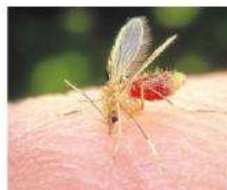
Transmissor - o Phlebotomus pappatasi , o mosquito palha