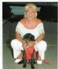
RESGATADO DA ENCHENTE. O vira-lata Atrium deixou a vida da apresentadora Hebe Camargo muito mais animada

deste texto, provavelmente ficará com vontade de dar um abraço bem apertado no seu melhor amigo. Não se reprima! Ah, você ainda não tem um bichinho de estimação para chamar de seu? Nunca é tarde para adotar.